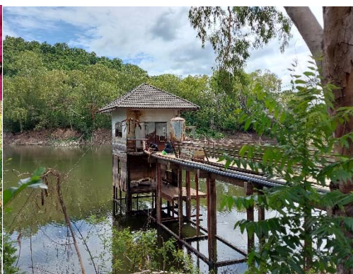
รูปที่ 8 จุดเก็บตัวอย่างน้ำ บ่อรับน้ำ No.3