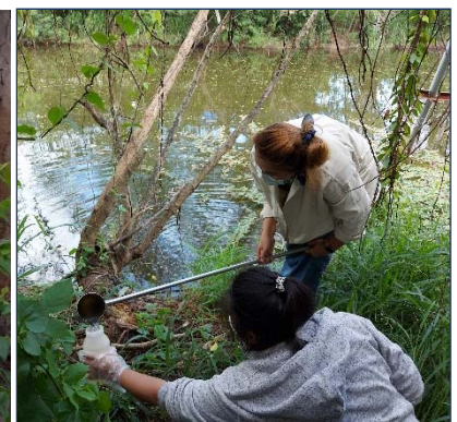
รูปที่ 9 จุดเก็บตัวอย่างน้ำ บ่อรับน้ำ No.20