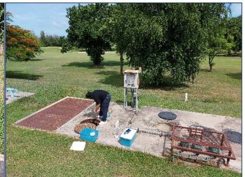
รูปที่ 5 จุดเก็บตัวอย่างน้ำ ระบบบำบัดน้ำเสีย อาคารโรงแรมส่วนขยาย (น้ำเข้า)