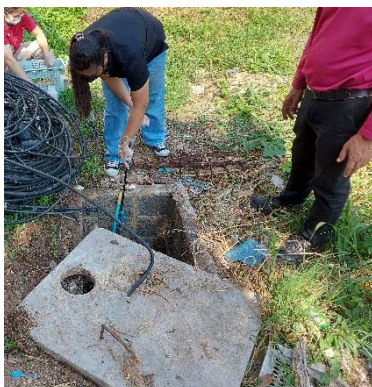
รูปที่ 7 จุดเก็บตัวอย่างน้ำ ระบบบำบัดน้ำเสีย อาคารโรงแรมส่วนขยาย (น้ำเข้า)