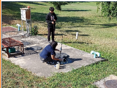
รูปที่ 4 จุดเก็บตัวอย่างน้ำ ระบบบำบัดน้ำเสีย อาคารโรงแรมส่วนเดิม (น้ำออก)