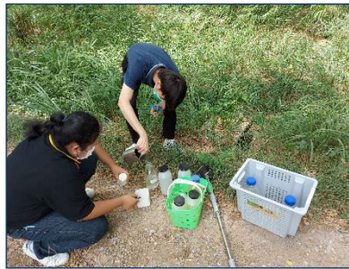
รูปที่ 2 จุดเก็บตัวอย่างน้ำ ระบบบำบัดน้ำเสีย อาคารคลับเฮ้าส์ (น้ำออก)